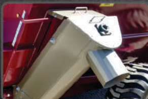
CONTROLE DE VAZÃO